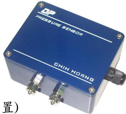
■ 壓力感應單元結構示意圖